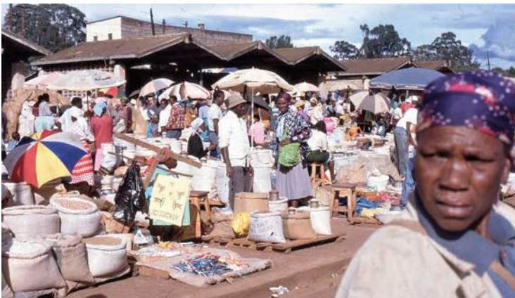
2. kép. Élelmiszer egy vidéki város nagy piacán (1993, Kenya, Rititi)