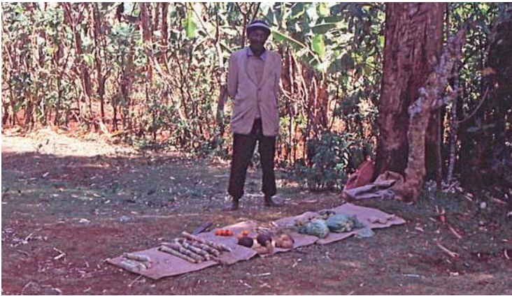
1. kép. Amit tud, megpróbál eladni a kistermelő (Fotó: Sárkány Mihály, 1993, Kenya, Rititi)

Nemcsak a tejtermelő gazda élt, kalkulált a lehetőségekkel, hanem, mondhatni, mindenki. Ez a gondolkodásmód magában foglalta annak a lehetőségét, hogy bármit piacon értékesítsenek, amire a háztartásnak nincs szüksége. Még a csekély fölösleg eladását is megkísérelte az, akinek erre lehetősége volt, amint az 1. képen látható. Akiknek valamiből nagyobb mennyiségű terménye volt, nagy piacokra vitték el, elsősorban a közeli Karatina híres piacára (2. kép), de még Nairobi piacaira is, ha akadt autó, amelyik elszállítja.